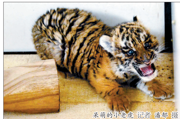
采萌的小老虎

本报讯(记者 赵佳 通讯员 乔丽娜)昨日,记者从王城公园动物园了解到,我市新添3只华南虎宝宝。至此,我市人工繁育华南虎总数已达30只,位居全国第一。目前,我市人工繁育华南虎成活率约为90%,高于全国平均水平。