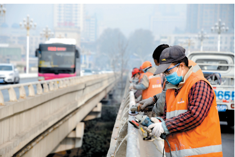
王城大桥护栏除锈