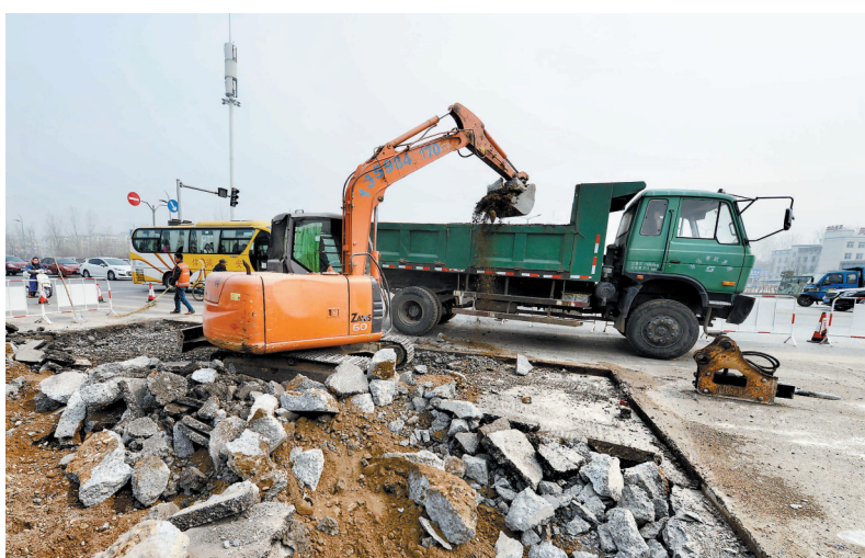
王城大道与伊洛路路口路面病害治理