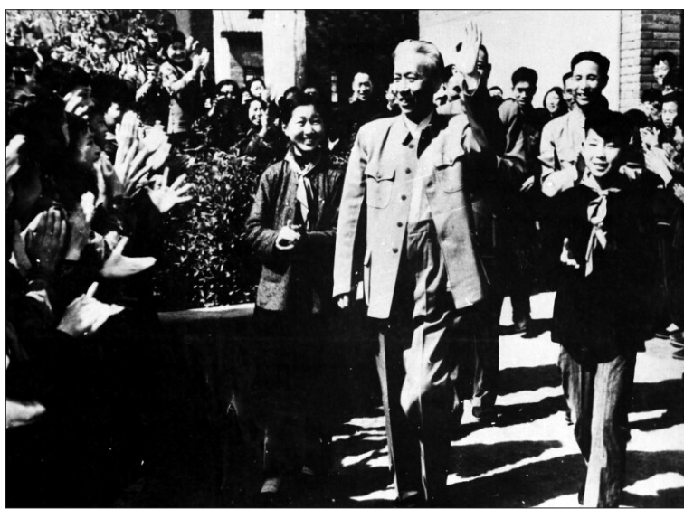
刘少奇视察敬事街小学(资料图片)