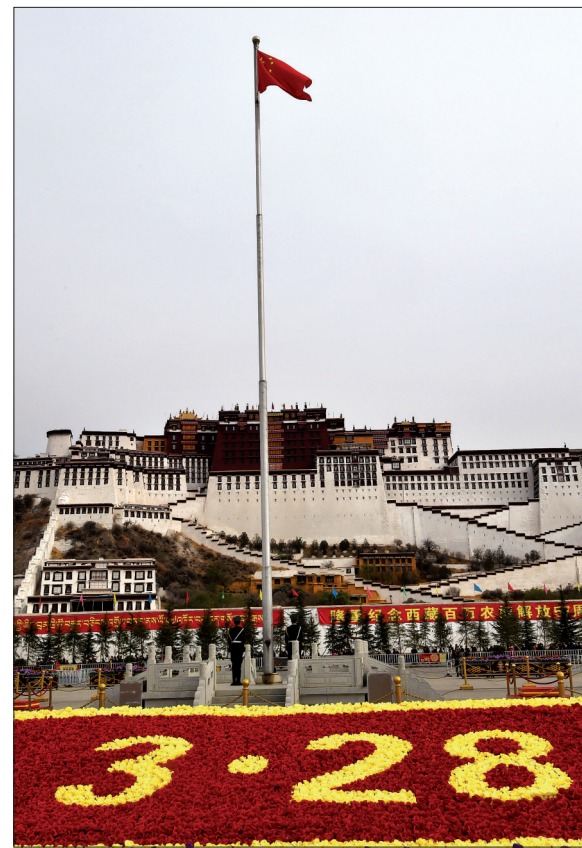
拉萨:升国旗 唱国歌 庆祝百万农奴解放纪念日

这是3月28日拍摄的布达拉宫广场。当日,西藏各族各界代表聚集在拉萨布达拉宫广场,升国旗,唱国歌,庆祝百万农奴解放纪念日。2009年1月19日,西藏自治区九届人大二次会议决定,将每年3月28日定为西藏百万农奴解放纪念日。