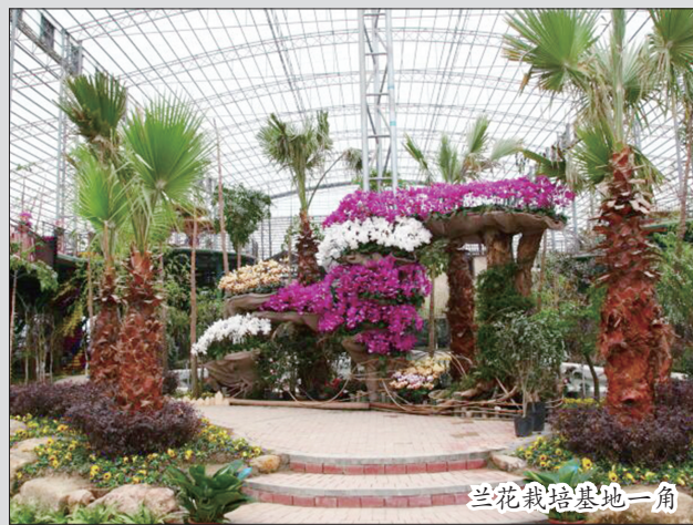
兰花栽培基地一角

台湾素有祖国的宝岛之称,不过对大多数人来说,想去台湾来一场清新、浪漫的旅行仍非易事。今年五一期间,洛阳台湾花博园将与广大游客见面,我市居民在家门口即可欣赏到美丽的台湾风光,体验到浓郁的宝岛风情。