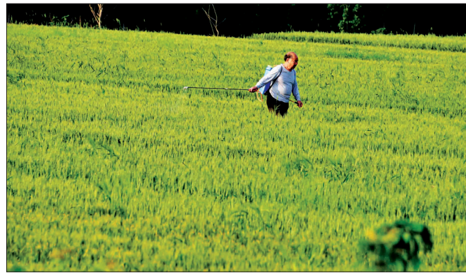
搞好麦田管理 打下丰收基础

昨日,在中船重工第七二五研究所洛阳双瑞风电叶片有限公司,一批2兆瓦新型复合材料风力发电叶片正在接受出厂检验,准备发运。 近年,双瑞公司坚持科技创新,持续加大科研成果转化力度,研发的新型风电叶片不仅满足国内新能源开发需要,还成功打入海外市场,出口国家也从韩国、印度扩大到美国、德国和日本。今年第一季度,洛阳双瑞风电叶片公司完成产值3.3亿元,同比增长61%。