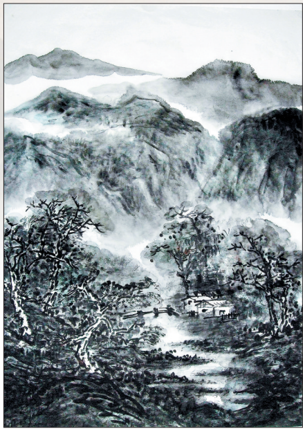
崇阳镇古风貌图 袁剑帆画

位于全宝山北麓,松阳河滨的洛宁县下峪镇崇阳村,古代曾设崇阳关,明清和民国时期曾设崇阳镇。作为曾经的豫西名镇,这个山村有很长一段故事。