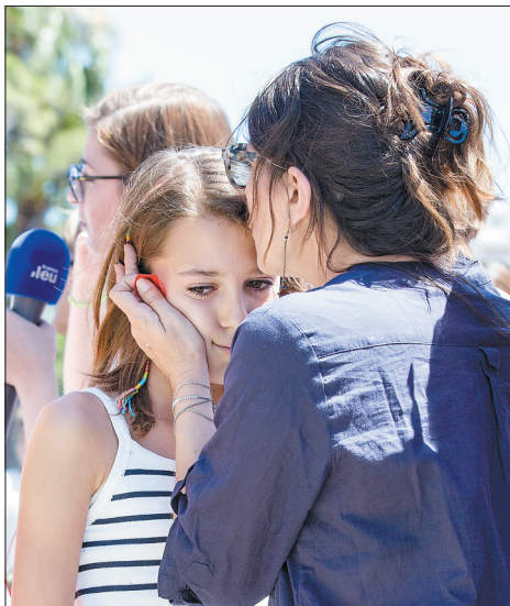
七月十五日,在法国尼斯,人们在袭击事件现场附近互相安慰。