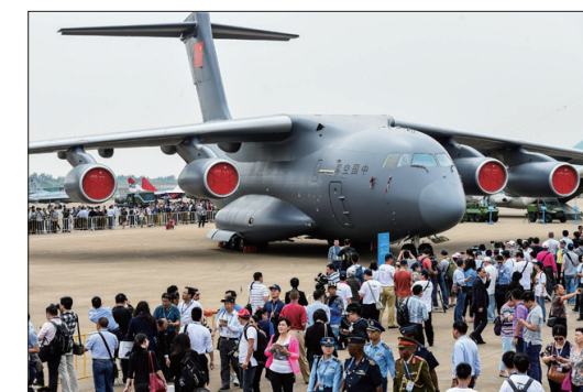
运-20大型运输机亮相航展