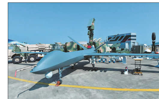
“彩虹五号”(CH-5)中空长航时无人机

1日上午,两年一届的中国国际航空航天博览会正式拉开帷幕。为期6天的航展吸引了来自42个国家和地区的700多家厂商参展,境外展商比例占45%,规模达到历届之最。歼-20隐形战斗机、空警-500预警机、歼-10B战斗机等18个型号的飞机、地导、雷达等主战装备及39种型号的配套武器等共110余件国产军事装备成体系参展,其中过半是首次公开亮相。