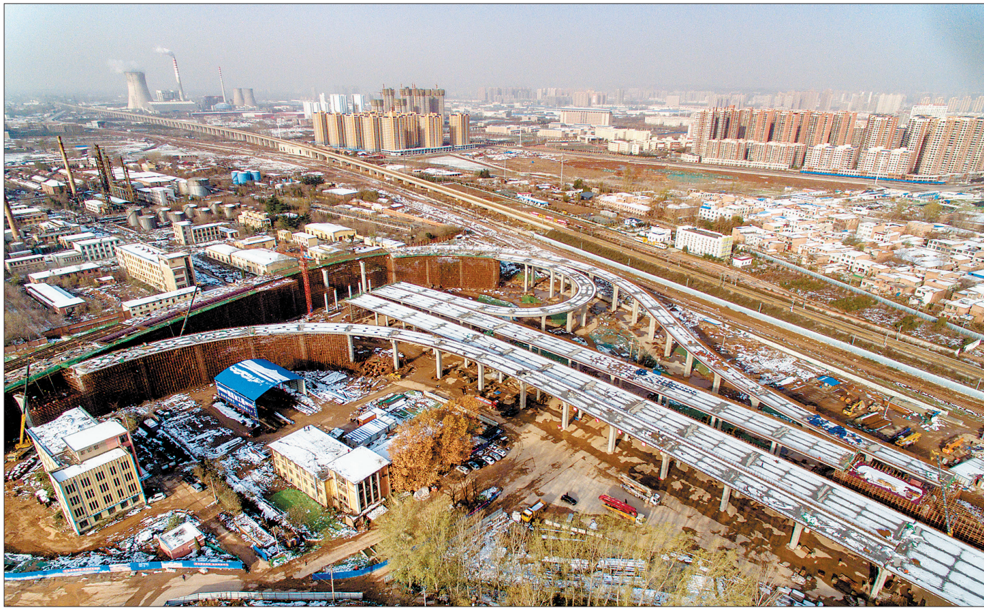
南环路与王城大道互通立交工程现场