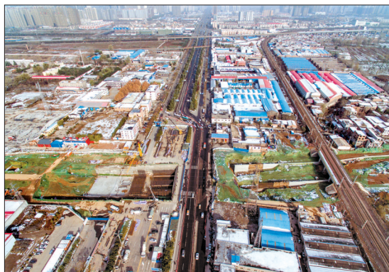
南环路与龙门大道互通立交工程现场