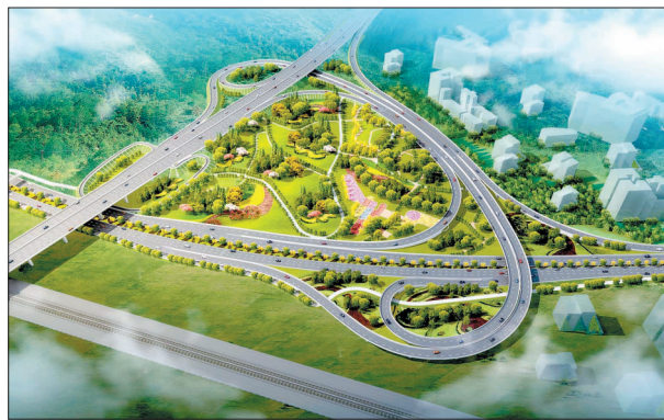
南环路与王城大道互通立交工程效果图