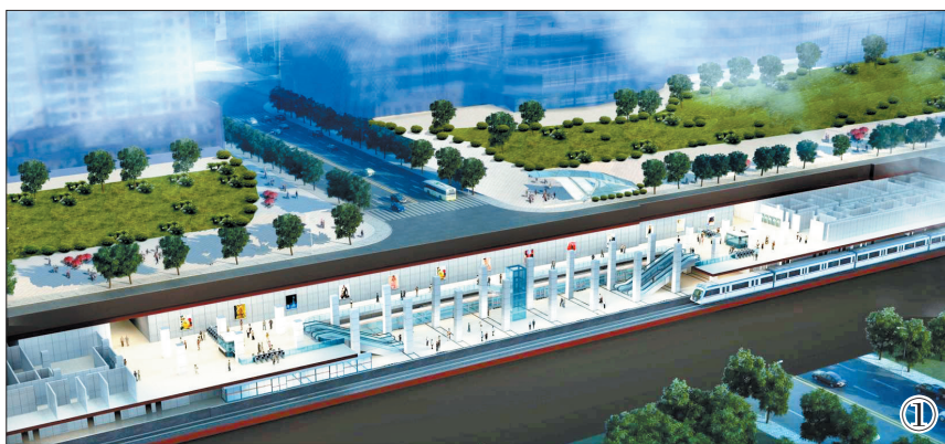
地铁史家湾站效果图

该路口在地铁工程试验段施工期间,将取消现有交通信号灯,并在围挡外侧设置波形护栏,确保车辆行驶安全。