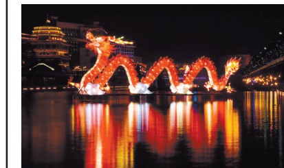
上图 这是2月7日在湖北省宣恩县贡水河畔拍摄的“龙戏水”造型彩灯。