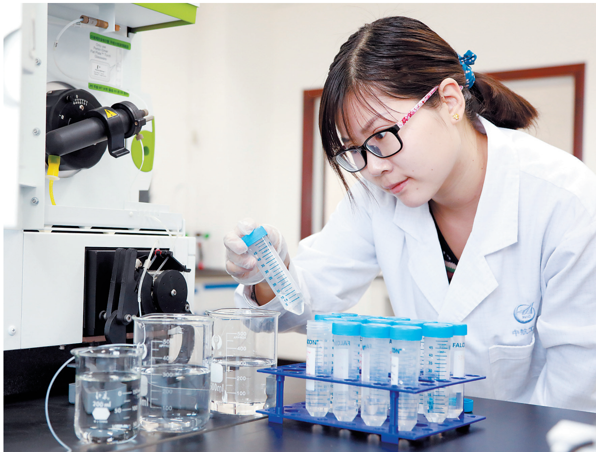
检测三元材料的元素含量