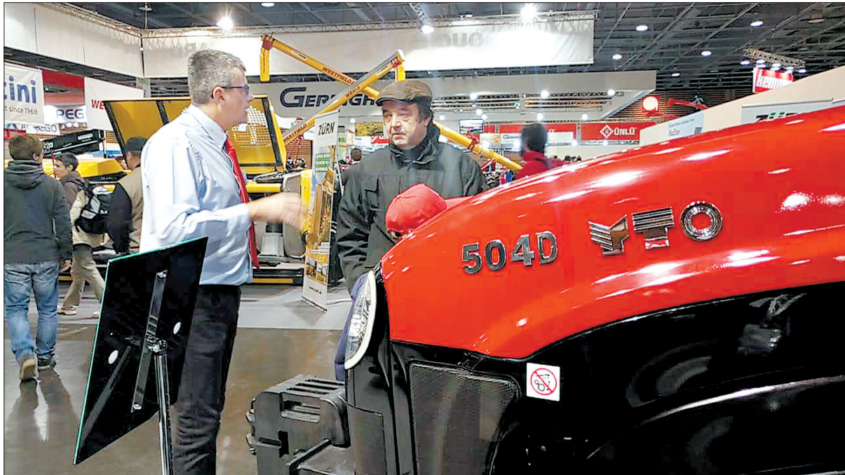
观众在中国一拖展区了解产品 (资料图片)

在展会现场,为了使全球更多的经销商和用户了解中国一拖,中国一拖法国公司进行了多种形式的企业及产品宣传,主要包括中国一拖历史、中国一拖生产加工能力、研发试验能力及YTO拖拉机全系列产品介绍。在中国一拖召开的记者会上,包括LA FRANCE AGRICOLE在内的知名杂志及行业媒体记者悉数出席。法国农机杂志记者表示,将把中国一拖作为重点拖拉机