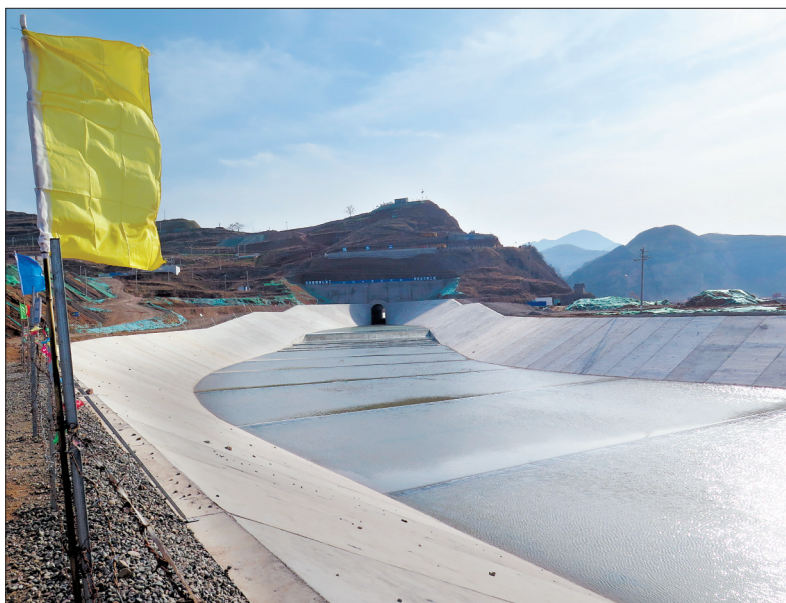
北汝河穿过导流洞,向下游流去

2日,阳光明媚。我们从汝阳县城出发,沿临木路(临汝镇至木扎岭)向西南行9公里,来到前坪水库施工现场。蜿蜒的北汝河穿过导流洞,沿河道缓缓向下游流去。阳光下,河面波光粼粼,宛如一条银色巨龙,翩翩起舞。