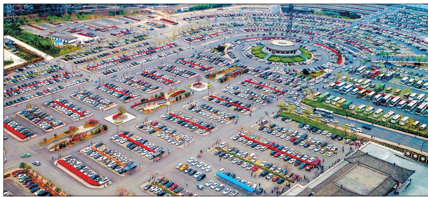
紧张而有序运转的龙门停车场