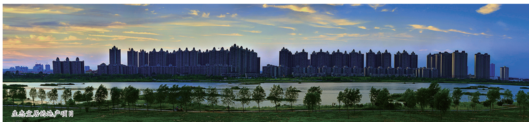
生态宜居的地产项目