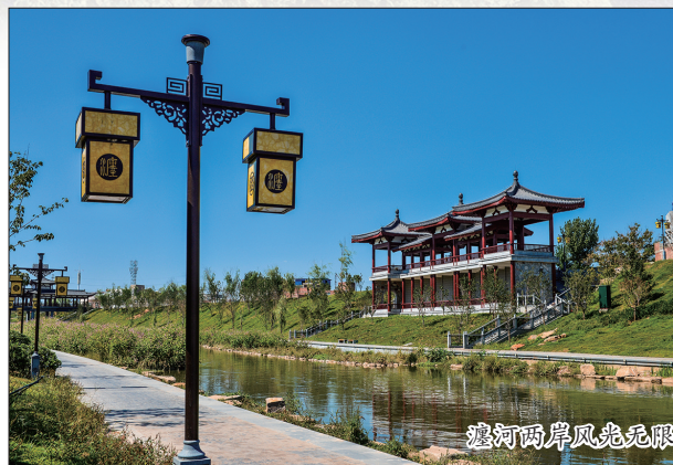
瀍河两岸风光无限

实行跟踪问效,发现问题及时解决。同时,该区认真落实商事制度改革,推行“互联网+政务服务”,进一步优化政务服务平台。充分发挥政府主导作用,大力推进银企对接,为企业、项目融资贷款牵线搭桥,努力拓宽融资渠道,着力破解融资难问题。完善事中事后监管制度,落实“双随机一公开”,坚决杜绝吃拿卡要和不作为、乱作为现象,全方位为投资者提供优质、高效和快捷的服务。 打造公正文明的法制环境。 该区实行企业收费登记制度和罚款备案制度,规范执法行为。对不规范的执法行为,予以严肃处理。深入开展企业发展和项目建设环境专项治理活动,严查严处破坏发展环境的人和事,切实维护和保护好企业、投资客户的合法权益,为企业发展保驾护航。 打造社会安定的人居环境。 该区通过立项争资、政府投资等多种形式,加强城市基础设施建设,加大环境整治力度;不断健全社会治安防控体系,加强对重点区域尤其是企业周边治安环境的管理和整治,严厉打击盗窃、敲诈、勒索等违法犯罪活动,严肃查处无理刁难、阻碍施工等不法行为,依法保护外来投资者的合法权益,为投资者创造舒心的生活环境和安心的创业环境。