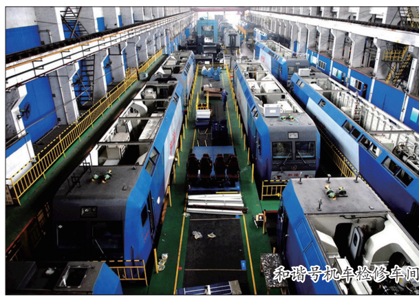
和谐号机车检修车间