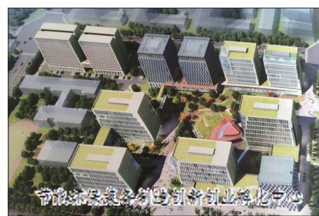
洛阳理工大学生创新创业孵化中心