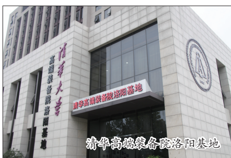
清华高端装备院洛阳基地

此外,高新区制定了涉及土地、厂房、税收、人才、科技研发及新能源汽车生产资质等方面的新能源汽车产业园区专项优惠政策,为入园企业、科研机构提供扶持。