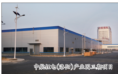
中航锂电(洛阳)产业园三期项目