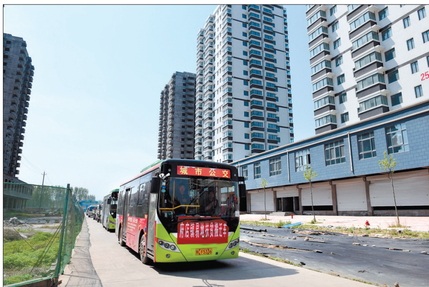
搬家车队驶入新居

4月13日至15日,偃师市易地扶贫搬迁涉及的府店镇安乐、来定、柏峪、车李、史家窑等5个行政村91户355人搬出了深山,迎来了新生活。这是该市全面打赢脱贫攻坚战、确保年底前整体脱贫实施的专项行动,旨在提前完成易地搬迁任务,让搬迁贫困户早日迁入新居,实现“搬得出、稳得住、能致富”的目标。