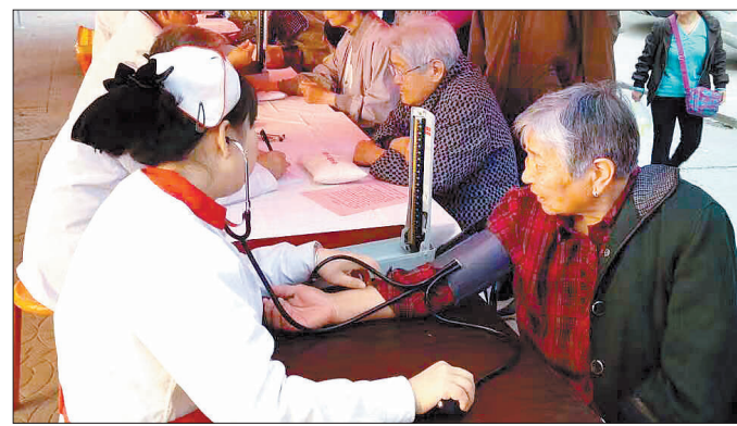
近日,涧西区西苑社区联合社会医疗机构开展中医进社区义诊活动,医护人员免费为社区居民测量血压,宣讲健康知识