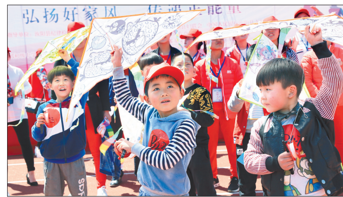
近日,汝阳县纪检委、总工会、文明办、妇联、县农商行等单位联合举办“弘扬好家风 传递正能量”首届风筝节活动,倡导广大群众传承“好家风、好家规、好家训”,让孩子们从小养成良好的家风