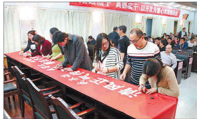
近日,伊滨区诸葛镇的党员们在传承廉洁家风横幅上郑重签下自己的名字。今年以来,该镇以道德讲堂为平台,在党员干部中广泛开展家风建设活动,引导群众传承和弘扬廉洁家风