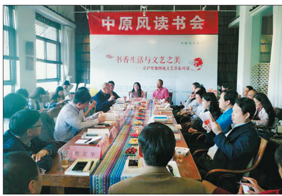
中原风读书会现场

“中原风读书会自创办以来,仅仅两年,就已举办读书活动30余场,今天在洛阳举办,是第一次走出省会城市……”23日“世界读书日”当天上午,在瓦库洛阳七号店召开的中原风读书会现场,河南日报报业集团副社长高金光代表主办方在致辞中说,此次读书会之所以选在洛阳,是因为“洛阳是最适宜读书的地方”。