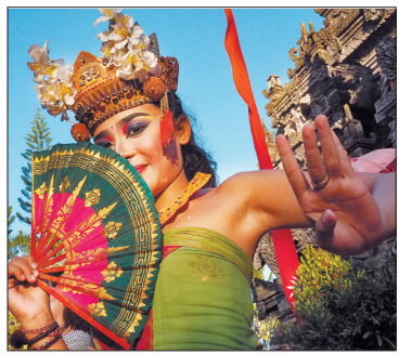
印尼民俗风情表演