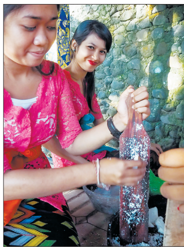
制作印尼特色美食

应印度尼西亚国家旅游部邀请,5月18日至24日,洛阳文化旅游经贸代表团一行12人先后在印尼首都雅加达,以及旅游胜地龙目岛、巴厘岛等地进行了旅游推介活动,双方就旅游和经贸方面合作进行了深入交流,代表团还在当地举办了“一带一路”看洛阳”摄影展览。代表团所推介的项目和展出的图片受到当地各界的高度评价,印尼官方表示,未来要和洛阳在文化经济方面开展更多的合作项目。