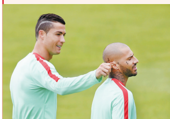
▲葡萄牙足球运动员克·罗纳尔多(左)揪队友耳朵