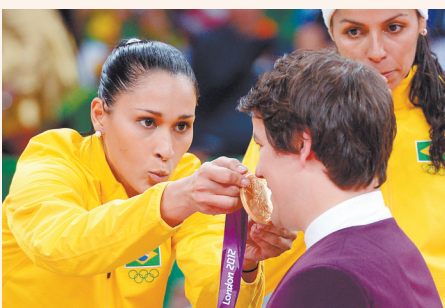
▲巴西排球运动员卡瓦略和礼仪先生开玩笑,把金牌递到他嘴边