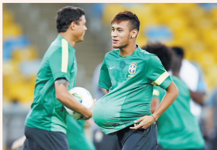
▲巴西足球运动员内马尔(右)在训练中“淘气”