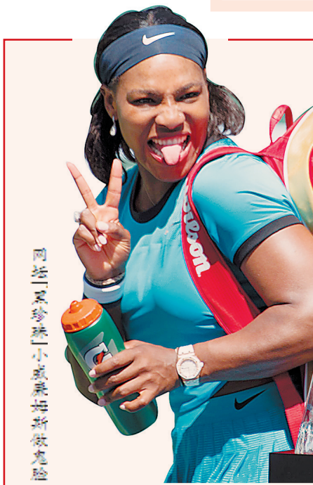
网球“小珍珠”小威赛后做鬼脸