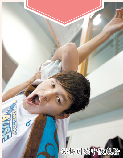
孙杨训练中做鬼脸