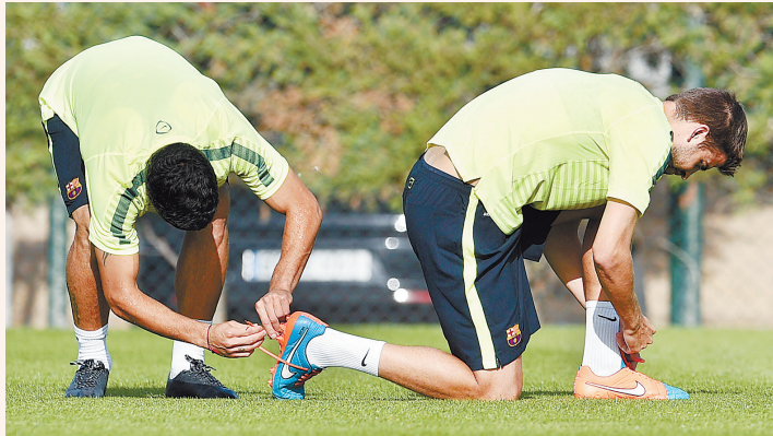
▲西班牙巴塞罗那足球运动员苏亚雷斯(左)在训练中偷偷把队友皮克的鞋带解开

他们是万众瞩目的体坛明星,人们通常见到的都是他们奋力拼搏、锐意进取的一面。但偶尔,他们也会展现出童心未泯的可爱一面。