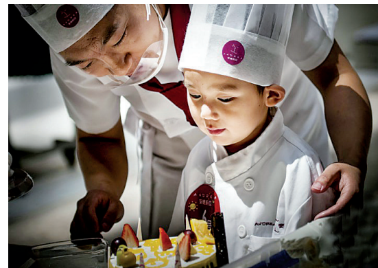
制作 焯子 摄

请作者建平、焯子将个人通信地址和联系方式发至 lyrbshb@163.com,以奉薄酬。