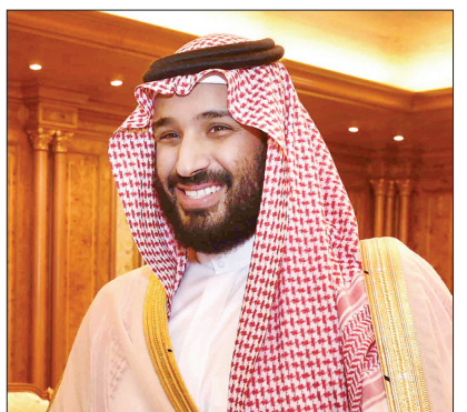
穆罕默德·本·萨勒曼 在伊斯兰教圣城麦加举行王室成员向穆罕默德·本·萨勒曼效忠的仪式。