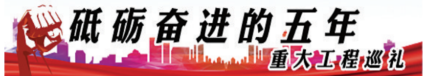
砥砺奋进的五年 重大工程巡礼

“在外国人认为不可能修铁路隧道的地质条件中,变不可能为可能、为现实,兰渝铁路不仅是铁路人的‘争气线’,更是中国人民的‘争气线’。”国际工程地质与环境协会副主席、秘书长伍法权说。