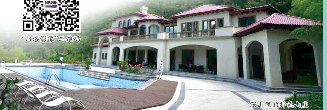
深山里的特色酒庄