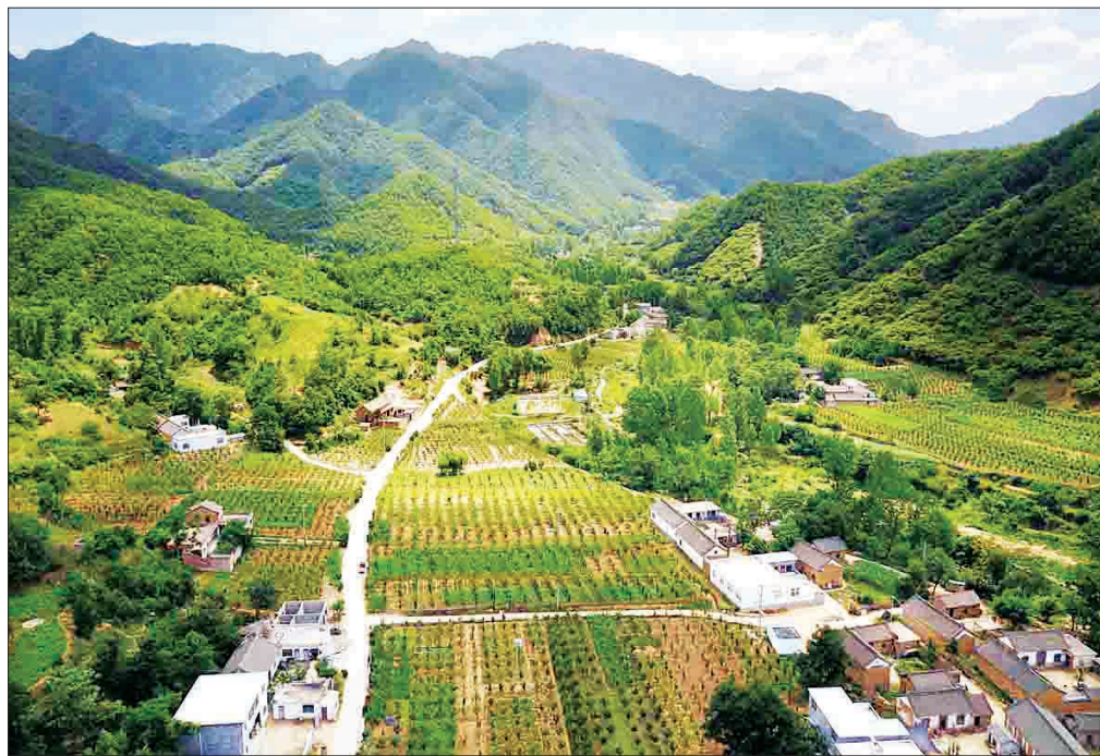
美丽山谷，满眼绿意