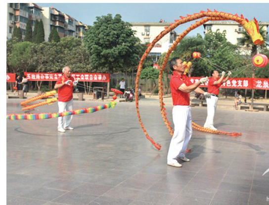
抖起来 平安2014 摄