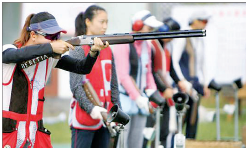
凤凰岭射击射箭基地赛事掠影(资料图片)