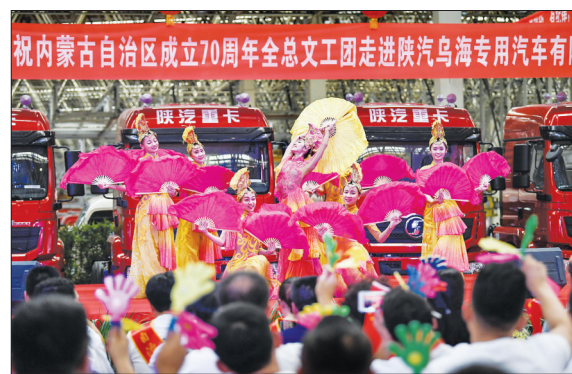
庆祝内蒙古自治区成立70周年全总文工团慰问一线职工

在京中共中央政治局委员、中央书记处书记,全国人大常委会副委员长,国务委员,最高人民法院院长,最高人民检察院检察长,全国政协副主席以及中央军委委员等参观了展览。