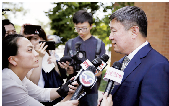
章莹颖案被告出庭 首次开口但拒绝认罪

7月21日,为庆祝内蒙古自治区成立70周年,全国总工会文工团来到位于内蒙古乌海市的陕汽乌海专用汽车有限公司,看望和慰问企业一线干部职工。