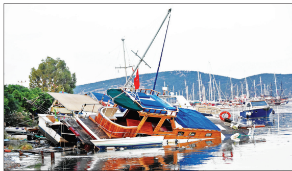
土耳其西南部发生6.3级地震

7月20日,在美国首都华盛顿,美国司法部部长杰夫·塞申斯出席新闻发布会。在一个被称为“里程碑式”的国际行动中,美国执法机构20日宣布,全球最大黑市交易网站Al-phaBay已被关闭。