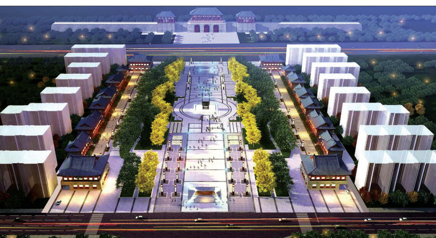
定鼎门文化广场效果图(资料图片)

同时,该文化广场设计遵循“惠民、利民、便民”的原则,设有多种便民服务、休闲娱乐设施。