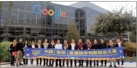
直通硅谷大赛优胜者在美国硅谷进行孵化