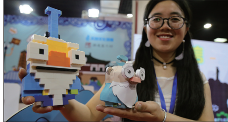
2017 中国·洛阳(国际)创意产业博览会举办