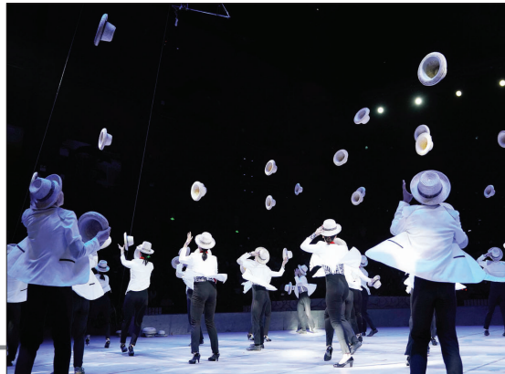
山东省杂技团演员表演《草帽》

第十届中国杂技金菊奖全国杂技比赛日前在山东蓬莱开幕,来自国内共28支顶尖杂技队伍的500多名选手携30个杂技节目齐聚蓬莱角逐中国杂技金菊奖。