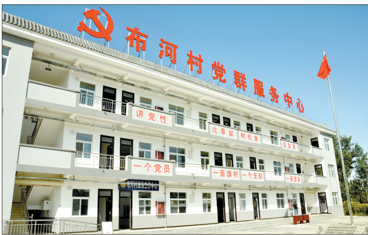
布河村党群服务中心

扶贫领域干部14名,树立起凭实绩用干部的正确导向。加大财政投入,2017年为第一书记专项列支121万元驻村经费进行健康体检、购买人身意外保险等,解除扶贫干部后顾之忧。2017年,全县驻村干部共完成项目申报65个、申报资金856万元,完成投资837万元,修复提灌站17座,水渠2.3万米,硬化道路255公里,化解矛盾62起,受到基层干部群众的一致好评。吴会菊 师娟 文/图