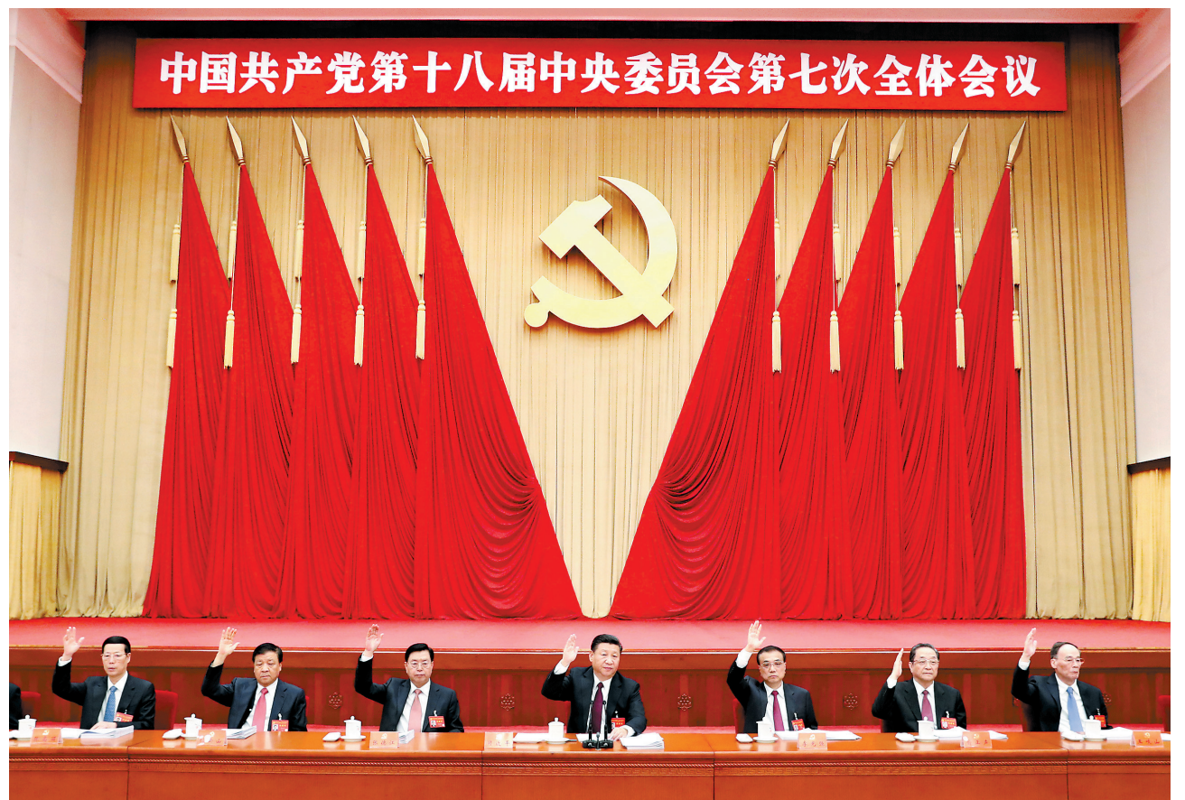
中国共产党第十八届中央委员会第七次全体会议,于2017年10月11日至14日在北京举行。这是习近平、李克强、张德江、俞正声、刘云山、王岐山、张高丽等在主席台上 (新华社发)

新华社北京10月14日电 中国共产党第十八届中央委员会第七次全体会议公报(2017年10月14日中国共产党第十八届中央委员会第七次全体会议通过)