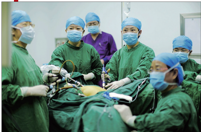
严于律己,慎于术中,精于术后