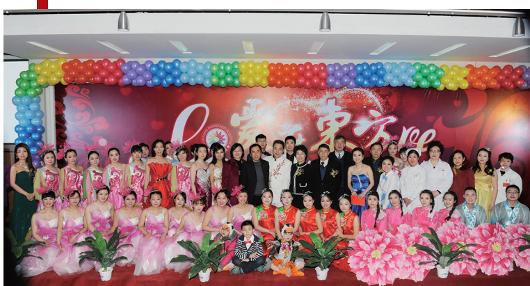
东方系列表彰会,弘扬先进文化