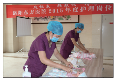
岗位练兵,技术比武