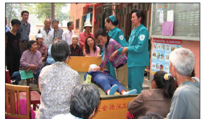
东方健康快车进社区