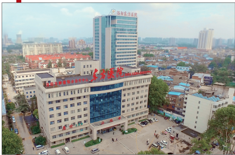
鸟瞰洛阳东方医院

六十年沧桑巨变,医院始终秉承“改革、创新、开放”发展理念,创新技术、创新管理、创新服务,整合资源,学科优势日益彰显,服务能力明显提升。