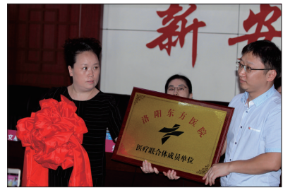
医联体建设提升基层服务能力