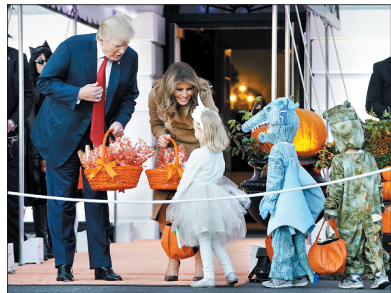
白宫举行万圣节活动

国务院法制办党组书记、副主任袁曙宏在当天举行的第十二届全国人大常委会第三十次会议上作说明。他说,考虑到目前涉及会计执业能力评价的考试较多,会计人员可以通过参加其他会计类考试证明执业能力,还可以通过接受继续教育、业务培训、学历教育等方式来提高专业能力和水平。据此,草案取消了会计从业资格认定。