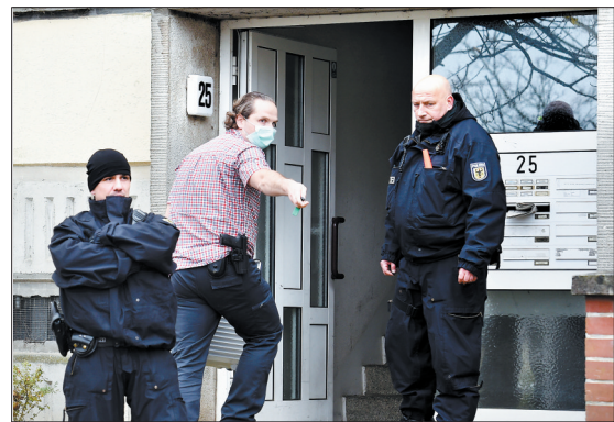
德国挫败一起炸弹袭击企图

10月30日,在美国华盛顿,美国总统特朗普(左)和夫人在白宫南草坪为孩子们分发糖果。美国白宫30日在南草坪举办万圣节活动。