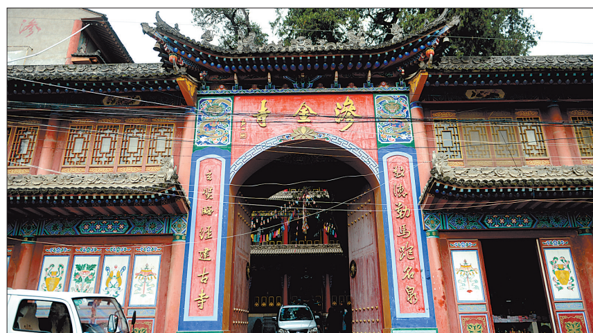
天水市渗金寺大门

渗金寺依山而筑,下院天王殿,中院大雄殿,后院卧佛殿。沿着天王殿侧面的楼梯一路向上,一张玄奘晒经图被勾画在楼梯尽头的墙面上。