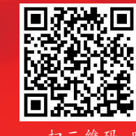
扫二维码,听记者原声诵读

十九大报告原文:十八大以来的五年,是党和国家发展进程中极不平凡的五年。五年来的成就是全方位的、开创性的,五年来的变革是深层次的、根本性的。五年来的成就,是党中央坚强领导的结果,更是全党全国各族人民共同奋斗的结果。