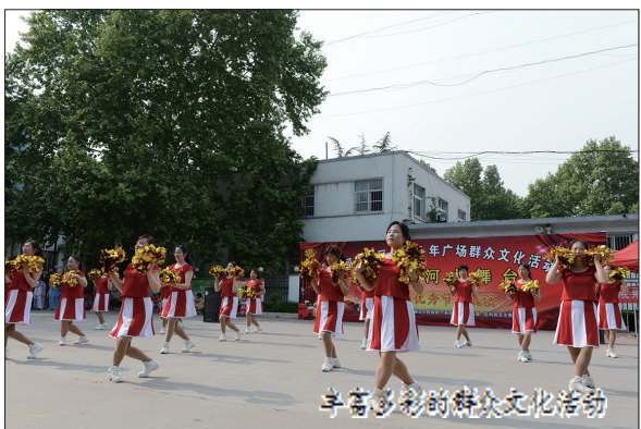
丰富多彩的群众文化活动