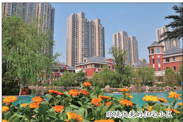
环境优美的住宅小区

60载辉煌历程,不忘初心,瀍河区一心一意谋发展,积淀了雄厚的实力。60年春华秋实,壮心不减,今天的瀍河区又站在了新的历史起点上。瀍河区将凝心聚力、砥砺前行,为全面建成更高质量的小康社会而不解奋斗!(白云祥 王少峰)