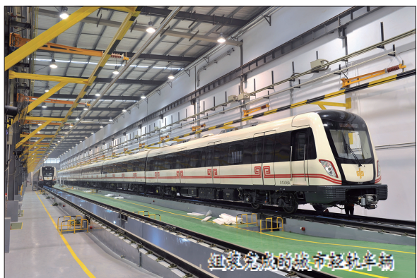
快速发展的城市交通条件