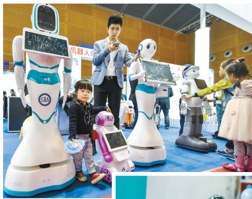
高交会上各类机器人

防雾霾窗纱、空气制水机、水下飞行潜艇、智能悬浮消防水枪、逃生背包、自动救助泳衣……在第十九届中国国际高新技术成果交易会上,展示了众多生活日用科技产品。一些产品尽管还显稚嫩,一些与实际推广应用还有距离,但让人切实感受到科技改变生活的无限可能性。