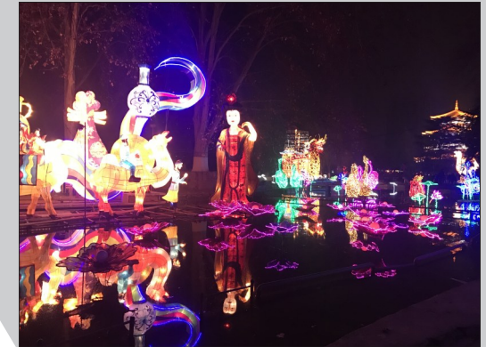
(图片均为资料图片) 绚丽花灯