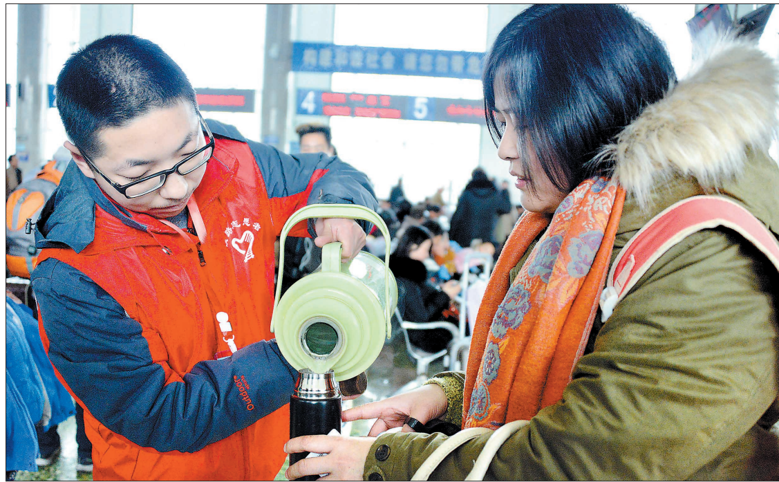
在洛阳站候车大厅,铁路青年志愿者给旅客倒水