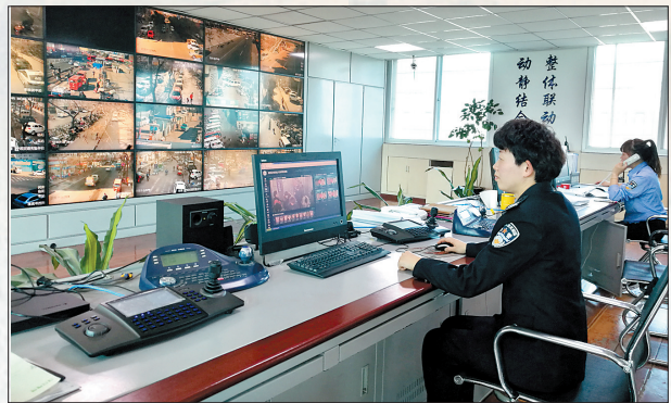
民警正在监控治安

车站派出所设在洛阳汽车站、锦远汽车站等地安装人证核验机,进行人证同一性验证。同时,安排民警持移动警务查询终端,对可疑人员进行二次核查。