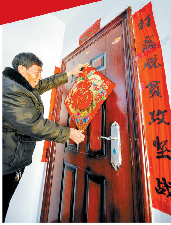
欢喜迎“福”到新家(摄于栾川县栾川乡后坪村)

易地扶贫搬迁是新一轮脱贫攻坚战的标志性工程。春节前夕,我市集中筛选44个能节前入住的易地扶贫搬迁项目,加快推动搬迁入住工作,让更多山区贫困群众在新家过了一个欢乐祥和的新春佳节。假日期间,本报记者走进搬迁社区群众家中,共同感受大山之外的新生活、新期待。