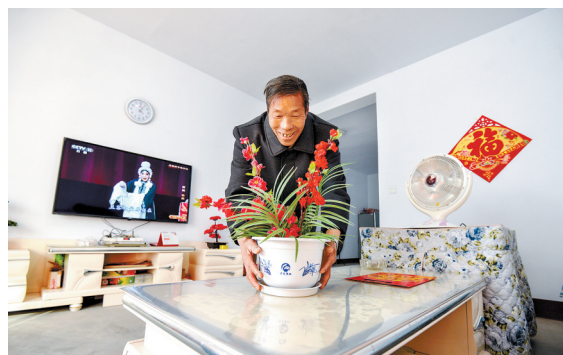
新家敞亮心里美(摄于栾川县栾川乡后坪村)