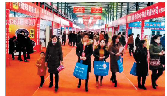
伊滨区庞村镇村民在赶别样“庙会”

这个春节,伊滨区庞村镇的农民朋友在自家门口赶起了“庙会”——成千上万的村民聚集在该镇的钢制家具产业集聚区内,逛一场独具特色的钢制家具博览会。