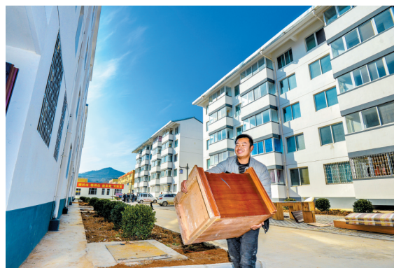
从此“搬”进新生活(摄于新安县青要山镇福苑社区)