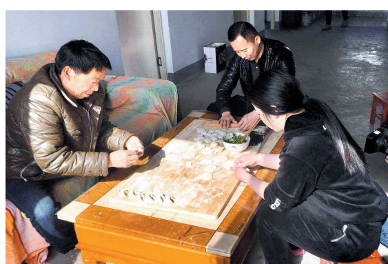
围坐一起包饺子(摄于新安县青要山镇田园村)