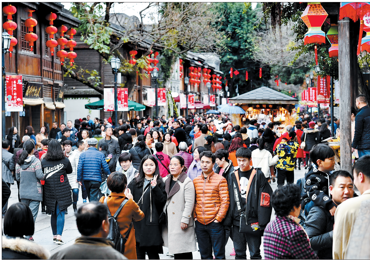
2月21日,游客在福州三坊七巷南后街游玩

出境游也备受青睐。中国旅游研究院和携程联合发布的报告预计,2018年春节出境游将在去年615万人次的基础上增加到650万人次,规模为历史之最。去南极大陆看企鹅、去北极圈看极光的“小众”路线也越来越受欢迎。