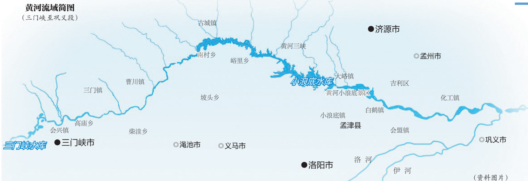
黄河流域简图 (三门峡至巩义段)