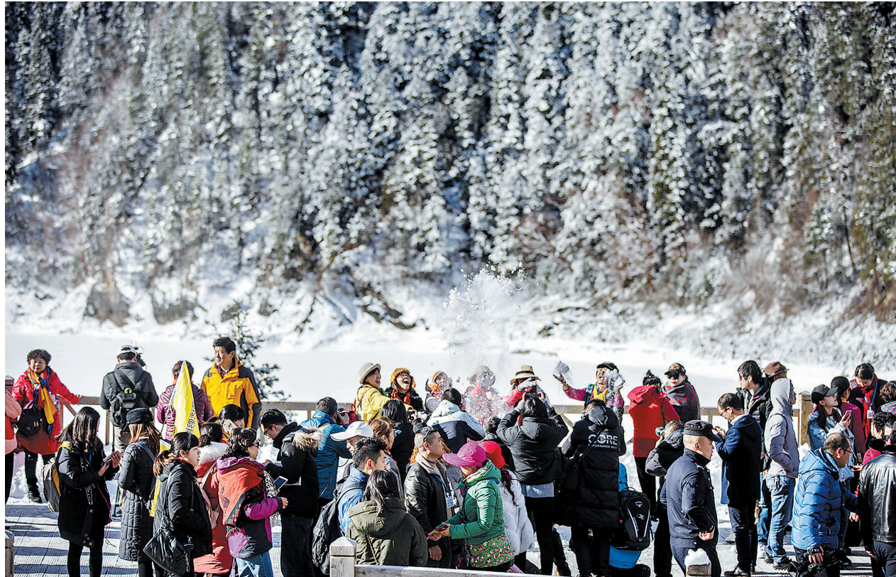
3月8日,游客在九寨沟长海景点游览