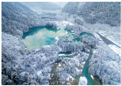
俯瞰春雪下的九寨沟景区树正群海