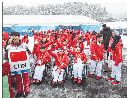
3月8日,中国体育代表团在升旗仪式上合影留念。当日,2018年平昌冬残奥会中国体育代表团升旗仪式在韩国平昌运动员村举行