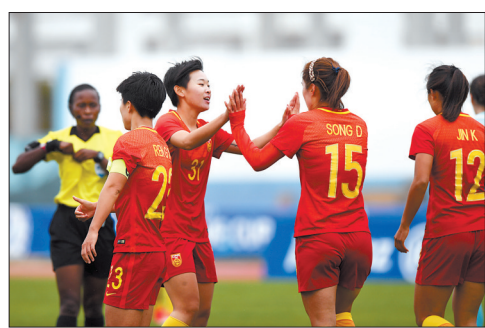
3月7日,中国女足队员在比赛后庆祝胜利。当日,在2018年阿尔加夫杯国际女足邀请赛第11名争夺战中,中国队以2比1战胜俄罗斯队,最终排名本届赛事第11名