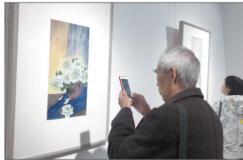
市民观展

本报讯(记者 朱艳艳 通讯员 牛珂)8日下午,洛阳美术馆女画家展赏月首场展出“尘外余光——官方瑜书画作品展”在3楼展厅开展。