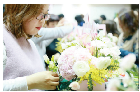
高端花艺沙龙现场

万物复苏的阳春三月,农行特别推出了“真爱玫瑰”贵金属、基金一折优惠等一大拨福利来点缀您的美,来回馈您的爱!