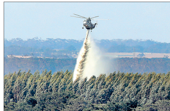
澳大利亚维多利亚州发生大面积山火

1月20日,土耳其对阿夫林地区发起代号为“橄榄枝”的军事行动,打击库尔德武装“人民保护部队”。叙政府则对土耳其在阿夫林发起军事行动表示强烈谴责,认为这一军事行动是对叙利亚主权的“野蛮侵犯”。