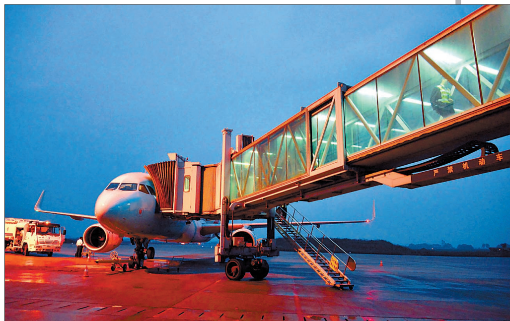
夜幕下,洛阳机场依然繁忙