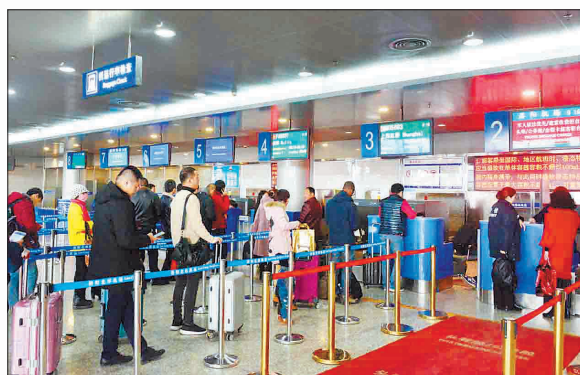
越来越多的旅客选择从洛阳机场出行