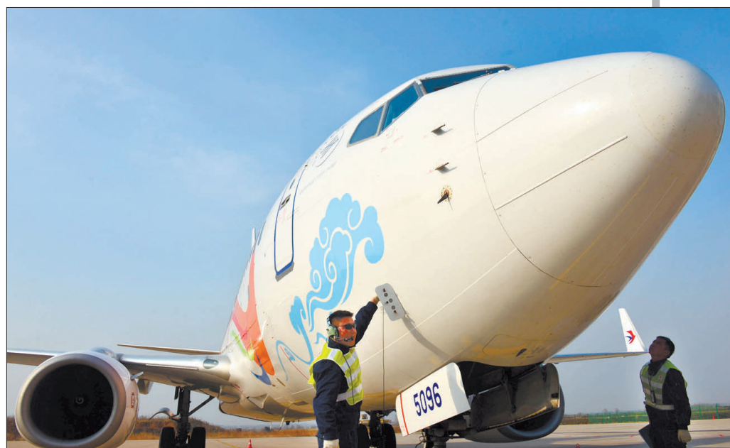
地面机务人员为客机提供细致而专业的保障服务

随着“空中走廊”越来越完善,洛阳机场的吸引力越来越大,越来越多的旅客选择从洛阳机场出行。洛阳机场通航城市数量和年旅客吞吐量均实现了近30年来的最高水平,迎来了洛阳民航高速发展的新局面。