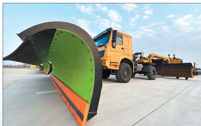
扫雪除冰等特种车辆到位,确保恶劣天气下航班安全起降

阳春三月,春暖花开。昨日,宁波—洛阳—乌鲁木齐航线首航仪式在洛阳机场举行。在第36届中国洛阳牡丹文化节开幕之际,越来越多的中外游客将通过这些航班架起的“空中走廊”,来洛赏花。