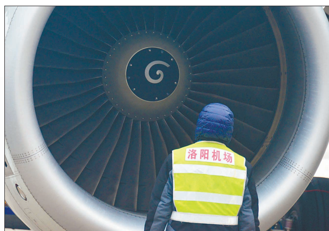
地面维护,一丝不苟