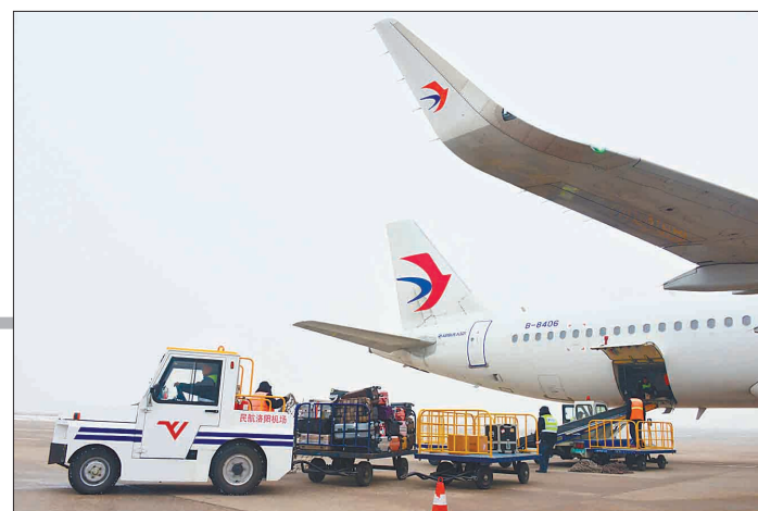
洛阳机场货邮吞吐量大幅增长