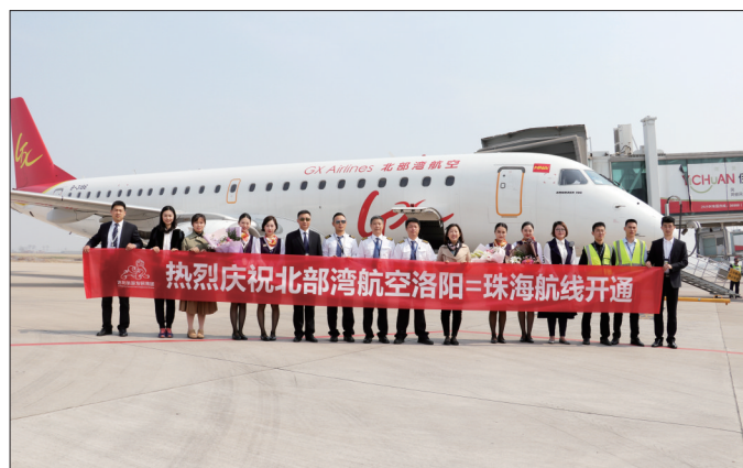
2018年3月25日,洛阳—珠海航线开通