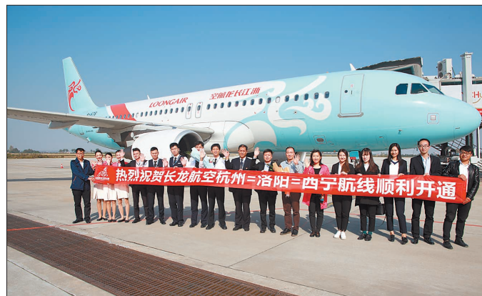
2017年10月29日,杭州—洛阳—西宁航线首航