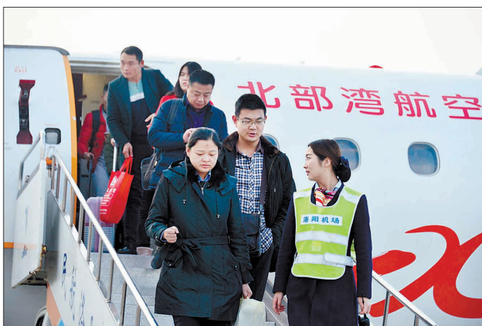
新增航线客座率在90%以上