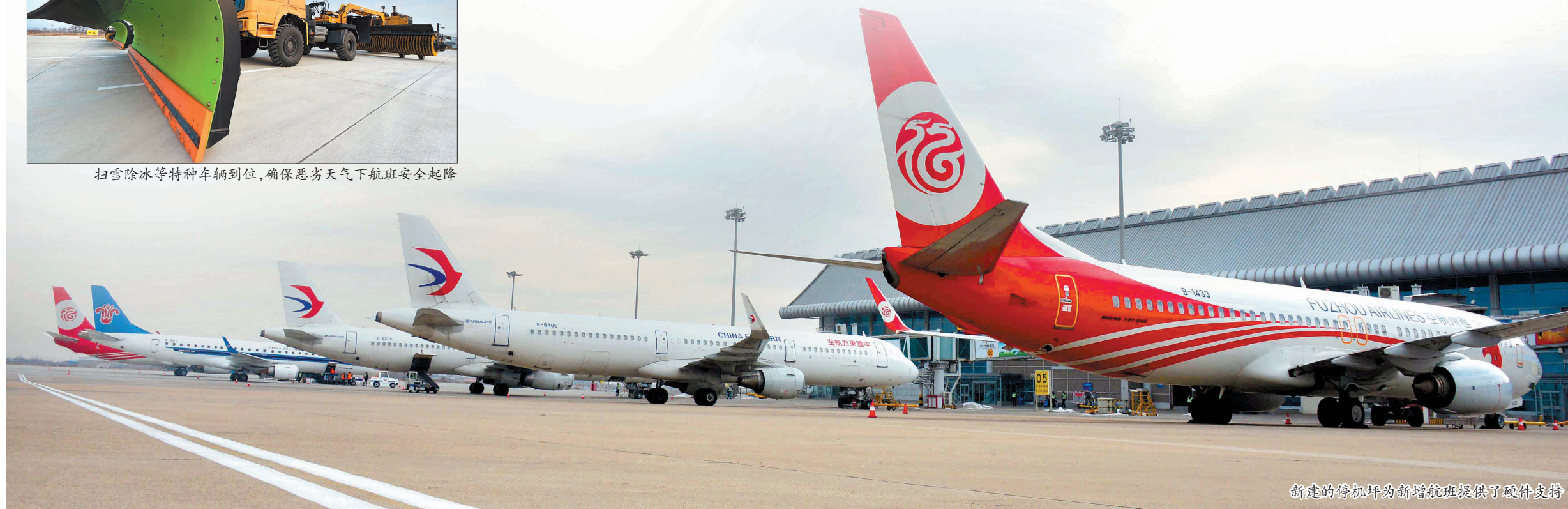
新建的停机坪为新增航班提供了硬件支持