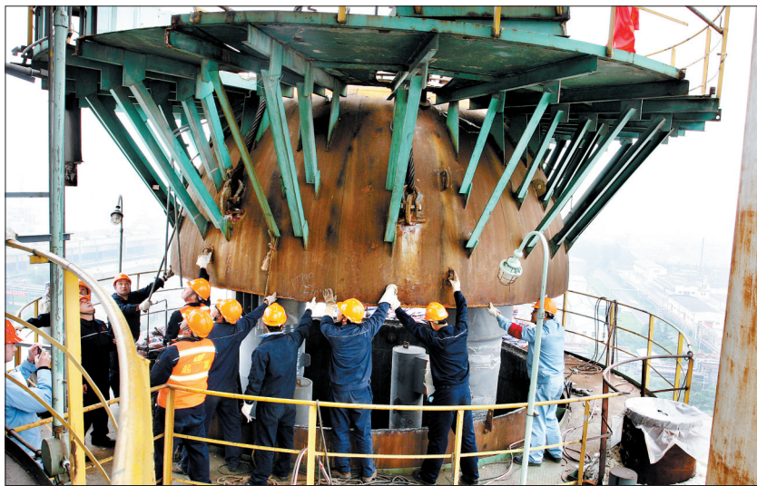
洛阳石化炼油结构调整项目核心设备2号催化裂化装置 (资料图片)

通过抓住项目建设这个“牛鼻子”,筑牢经济发展基础,推动全市实现高质量发展,成为贯穿全年的主基调。步入3月,随着我市及各县(市)区重大项目集中开工,洛阳产业项目建设呈现一片火热景象,为九大体系建设提供了坚实支撑——